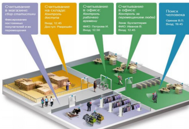
Рис. 5. Контроль доступа, мониторинг перемещения людей