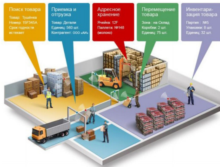
Рис. 3. Схема организации складской логистики с технологией RFID

Применение RFID технологии для складской логистики показано на рисунке 3.