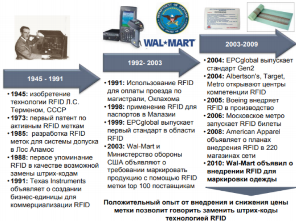
Рис.1. История развития RFID технологии

пространстве для организации мониторинга, идентификации груза, а также планирования.